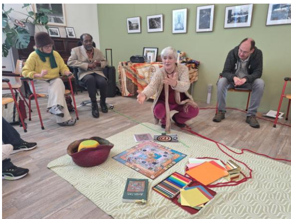
Introductie van de 6 mythische symbolen en het Amor Fati Samenspel