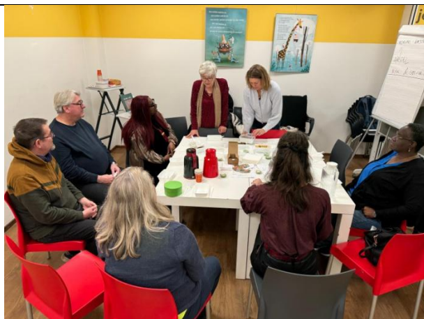
lunch met de vaste crew